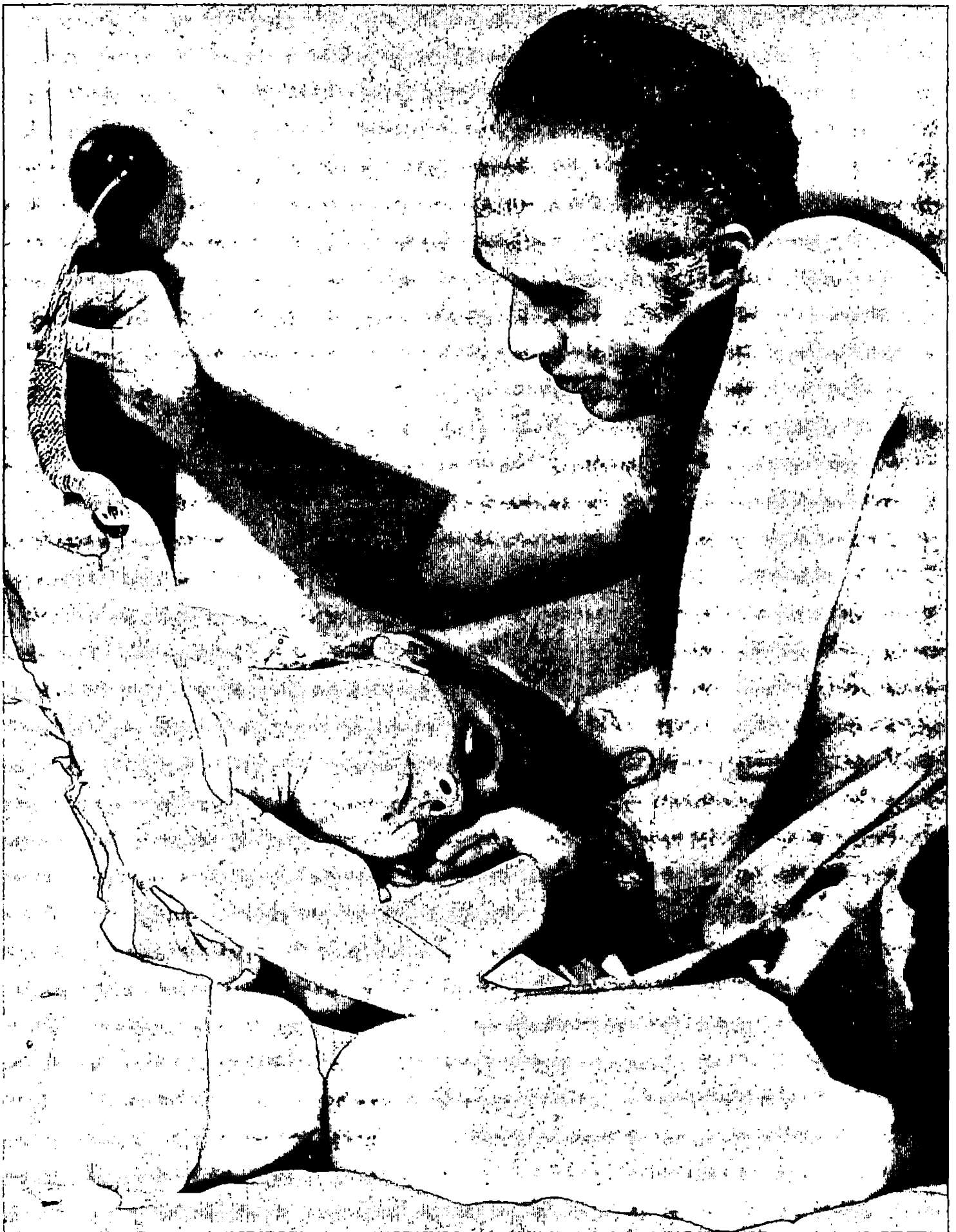
• DILLINGER E MORTO • (ANITA PALLEMBERG, MICHEL PICCOLI).